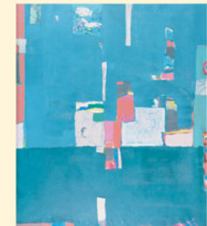
Detaljer i landskapet, 160x135 cm

Formann i styret for Kunstskolen i Trondheim Viseformann i styret for Trondhjems Kunstforening Medlem av den kunstneriske komite i Trondhjems Kunstforening Medlem av direktoratet for Kunsternes hus, Oslo Medlem av Nasjonalgalleriets innkjøpskomite Medlem av redaksjonsrådet for tidsskriftet Kunst og Kultur Konsulentoppdrag for Utbyggningsfondet for nye statsbygg