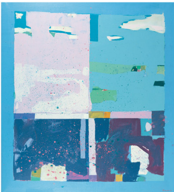
Vårlys, 165x135 cm