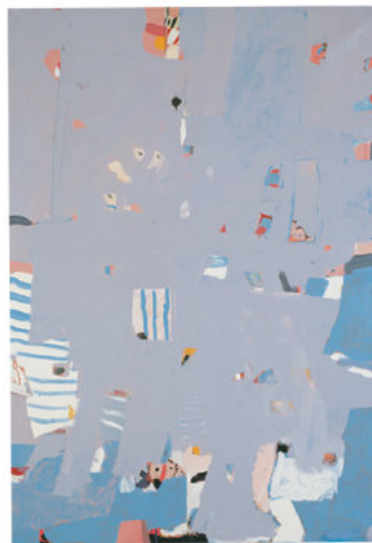
Strandbilde, 130x90 cm